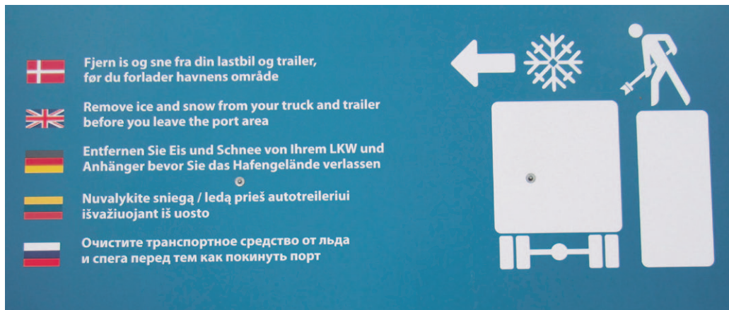
Billederne er fra snebroen på Fredericia havn